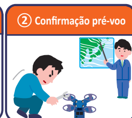
② Confirmação pré-voo