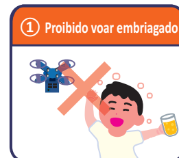
① Proibido voar embriagado

※ Se você quiser voar sem depender do método ⑤ ~ ⑩, será necessário aprovação pelo Ministro da terra, infra-estrutura, transporte e turismo, portanto favor seguir os procedimentos prescritos.