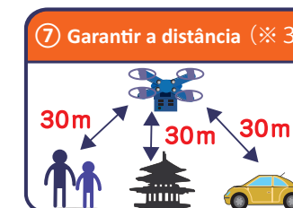
⑦ Garantir a distância (※ 3)

※3: Pessoa (Terceiro) ou Objetos (Objetos de terceiro, carro, etc) é necessário manter no mínimo 30m de distância.