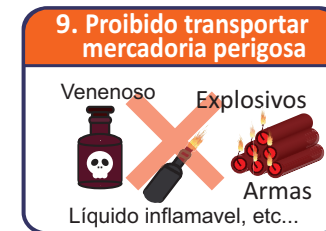
9. Proibido transportar mercadoria perigosa