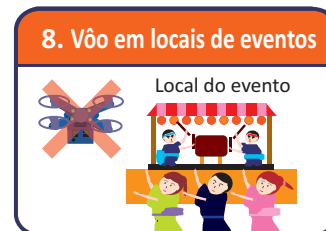
8. Voo em locais de eventos

※3: Pessoa (Terceiro) ou Objetos (Objetos de terceiro, carro, etc) é necessário manter no mínimo 30m de distância.