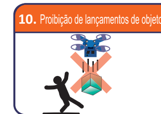
10. Proibição de lançamentos de objetos