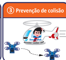
③ Prevenção de colisão