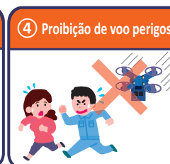
④ Proibição de voo perigoso