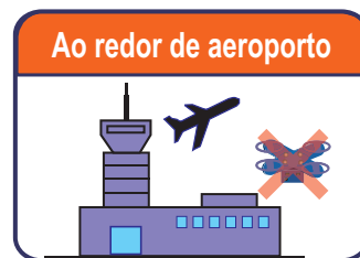
Ao redor de aeroporto

※ Se você quiser voar, precisa de solicitar a permissão do Ministro da terra, infra-estrutura, transporte e turismo.