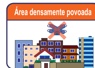
Área densamente povoada