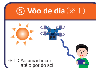
⑤ Voo de dia (※ 1)