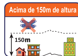
Acima de 150m de altura