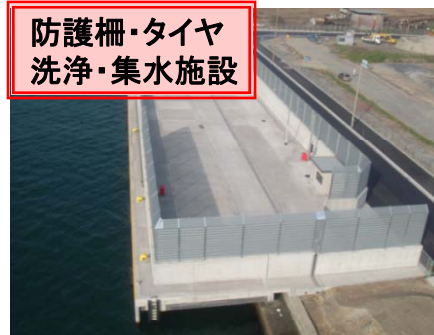
リサイクルポート岸壁 平成17年度整備