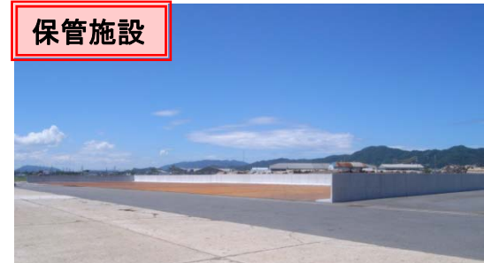
バラ貨物保管施設 平成23年度整備