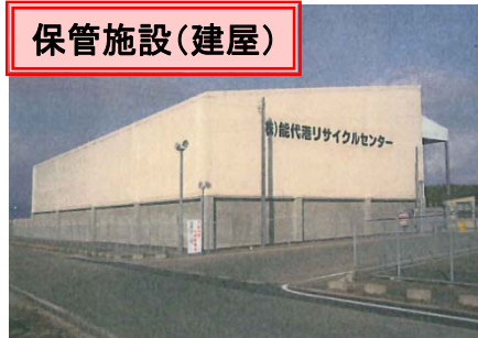
汚染土壌・石炭灰等保管施設 平成21年度整備