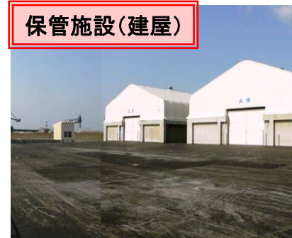
汚染土壌等保管施設 平成18, 20年度整備