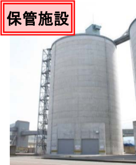
石炭灰保管施設 平成20年度整備