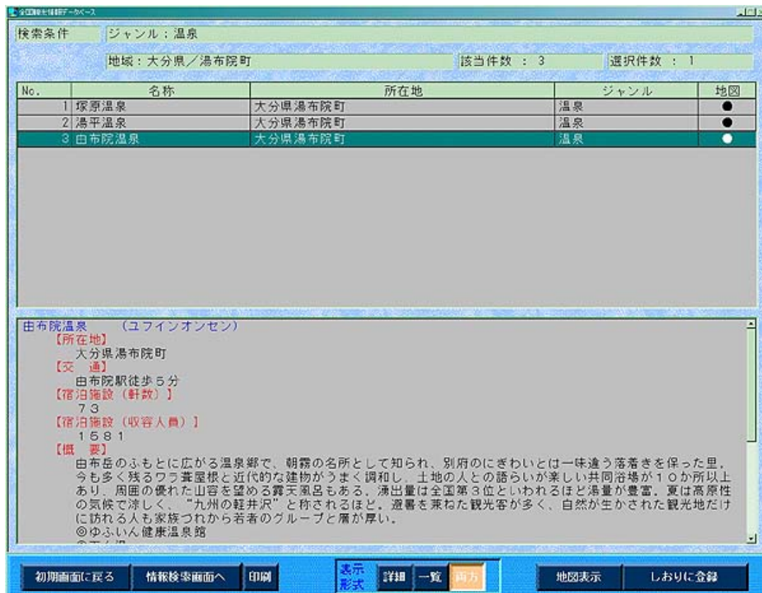
図3-1-1 全国観光情報データベース事例(その1)

平成12年度には、これらの各項目について位置情報(緯度経度情報)の付与を実施、完了した。