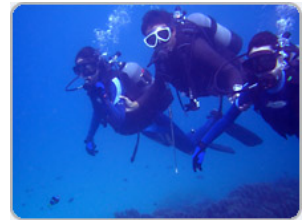
写真一一 ダイビング

「徳島県の阿波踊りでは観ただけの人は「面白かった」で終わってしまうが、踊った人は「また来たい」という意見が多くリピータも多い。体験させることでもう一度やりたいという気持ちにさせ、もう一度地域を訪れて貰う方法もある。」との意見に対して、「高知県の助成金で完成した「黒潮一番館」では地域の名物であるカツオのタタキを実際にカツオをおろして、焼いて、食べるという体験ができる施設として活用されている。」との紹介があり、体験型施設も再認識されました。