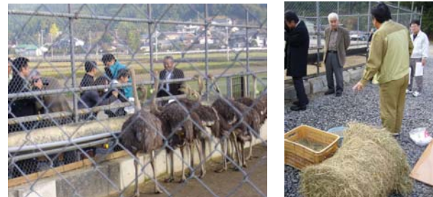
写真一七 ダチョウ's倶楽部

「宿毛市にある建設業者はダチョウの雛を飼育し、ダチョウ肉の試食会などを開催しながら飼料代や人件費等の経費を試算しダチョウの肉が地域に定着できるか販売経路やニーズなどのマーケティングを行っている。また将来的には牧場を観光牧場に開放するなど、新たな観光資源の開発を模索している。また、飼料に堤防除草の草を使用するなど異業種からの視点で取り組みを進めている。」