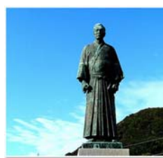
写真一六 ジョン万次郎