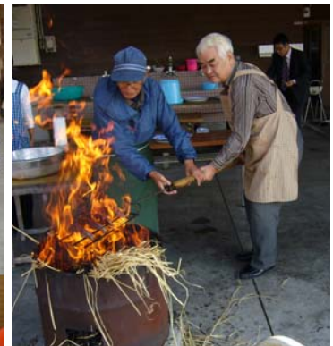
写真一二 カツオのタタキ体験

このように、様々な課題解決のためのヒントが提案される中で、「各市町村毎では他の成功例と同様な手法を用いて観光産業を勧めているところもあるが、全国的に広まっておらず情報発信に手詰まりを感じている。」との意見が出されました。それに対し有識者からは情報発信の手法例として、「鶴雅（北海道）にあるホテルでは冬の閑散期に観光客を誘致するため「マイナスをプラスに変えるような新たな視点」から「鶴雅は冬がいい」というキャッチコピーとともに「冬の鶴雅遊び方読本」を一緒にHPに掲載するという情報発信方法で観光客誘致