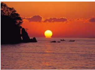
写真一八 だるま夕日

「様々な提案もあり広域的な取り組みが必要という事で、観光産業において各市町村の観光協会が統合した幡多広域観光協議会を設立し修学旅行向けの体験型の観光産業を進めているが、一般の観光客の誘致等もっと大規模に発展させたいと考えてる。そのためにだるま夕日（宿門市）、ホエールウォッチング（黒潮町）など観光資源を上手く活かして広域にPRしていく必要があるが、上手く進んでいないのが状況。」