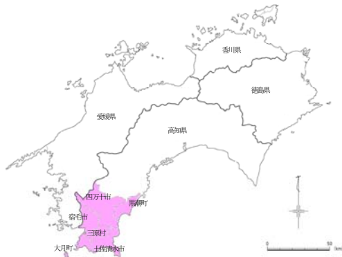
図-1 高知県西南部位置図

高知県西南部は高知県の西南部に位置する幡多地域の四万十市、宿毛市、土佐清水市、大月町、黒潮町、三原村の6市町村のエリアを表しています。