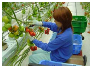
写真一五 トマト菜園