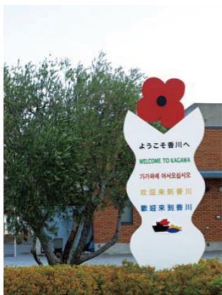
写真—1 4 外国語併記の観光案内板 2)

「瀬戸内芸術祭」では瀬戸内の魅力を世界に発信し、地域の伝統工芸や芸術家を世界へ発信する事を目的にターゲット(観光客層)を「外国人」に設定し、3カ国語(英語、韓国語、中国語)による情報提供や受入体制を整え、徹底的に外国人向けに情報を発信したことから外国からの観光客誘致に成功している。ターゲットを定める事でターゲットが求める情報が何かを考え情報発信している。」といった成功例が紹介されました。