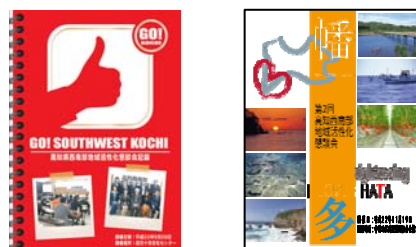
写真—1 5 懇談会議事録小冊子