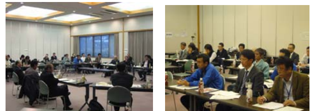
写真-2 第2回懇談会状況