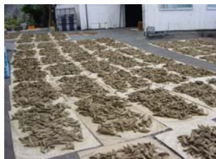
写真一三 宗田カツオ

「龍馬伝」の効果から高知県下に高知・安芸・梶原・土佐清水の4つにサテライトが設けられ観光に力を入れているが、土佐清水のジョン万次郎のサテライトの入館者数6万7千人に比べ、梶原の入館者数は8万8千人、高知市のサテライトは56万9千人、安芸のサテライトは9万9千人となっているなど、道路整備の遅れによる時間的な関係から観光客の流れが松山から大洲を通して梶原・須崎・高知へというルートで流れており、土佐清水まで来ていないのが現状である。」