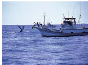
写真一九 ホエールウォッチング