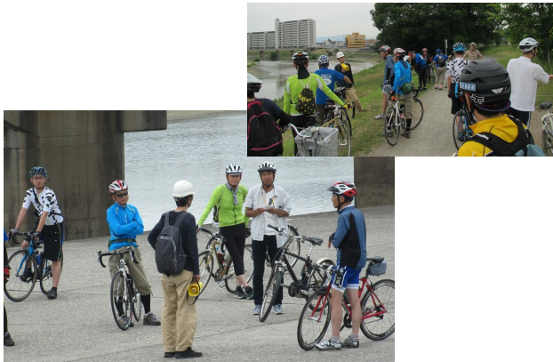
写真-12 市民団体との意見交換会

大和川水系には個性豊かなまちが多く、水辺の賑わい創出について、潜在的にかなりのポテンシャルがある。そんな大和川水系で、いま最も期待されているのが、下流の堺市域である。堺市域では現在、高規格堤防整備事業と一体となった土地区画整理事業が進められている。新たなまちづくりに合わせ、かわまちづくり支援制度を