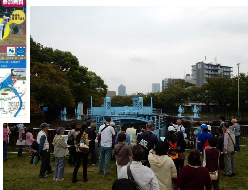
写真-10 淀川大堰・毛馬閘門見学会