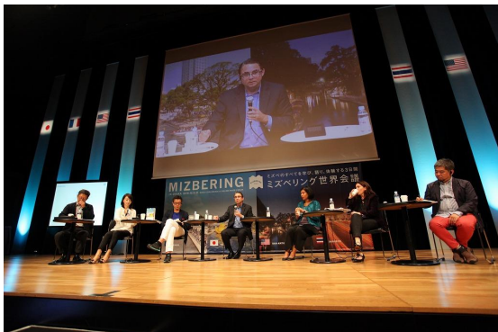
写真－5 ミズベシンポジウム（第1日目）

サンアントニオ、バンコク、パリ、そしてミズベ日本一の大阪で展開されている先進事例を通して、活動や事業を支える仕組み、民間活力の導入手法、ミズベをきっかけとした、まちの使いこなし方やマネジメント手法などを各国がプレゼンテーション。その後、パネリストとコーディネーターによる水辺を活かしたまちづくりの手法や各都市の将来展望などについてパネルディスカッションを行った。