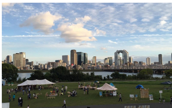
写真-9 淀川アーバンキャンプ 2015

ミズベリング世界会議のプレイベントとして開催。淀川活性化の実験事業としてグランピング・キャンプやクルーズなど大阪キタの摩天楼（ビル群）を眺めながら自然を楽しむイベントを実施した。また、「ミズベリングよどがわ」プロジェクトとしてゲストスピーカーを迎え、淀川の観光活用に向けたディスカッションを行った。