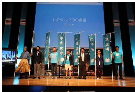
写真－6 ミズベワークショップ（第2日目）

水辺を愛する国内外の活動家や有識者、事業者などミズベに恋するキーマン（トップミズベラー）達がチームに分かれてワークショップを開催。活動のきっかけや失敗談、将来の夢を5つのテーマ（見つける、伝える、設える、育てる、広げる）で議論した。また、淀川に浮かぶ船上会場からの生中継も行った。