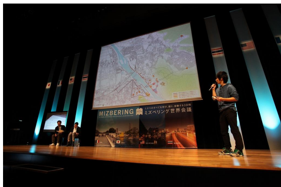
写真-7 大学連携・学生発表（第3日目）

関西を中心とした建築・都市系7大学の学生達が、「水」・「アーバンデザイン」・「エアリアマネジメント」をテーマに様々な対象地を設定し、未来のミズベのあり方をダイナミックに提案。それらを有名建築家や行政担当者、大学講師達が講評を行った。