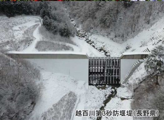
越百川第3砂防堰堤(長野県)