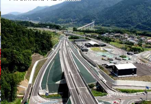
中部横断自動車道(山梨県)