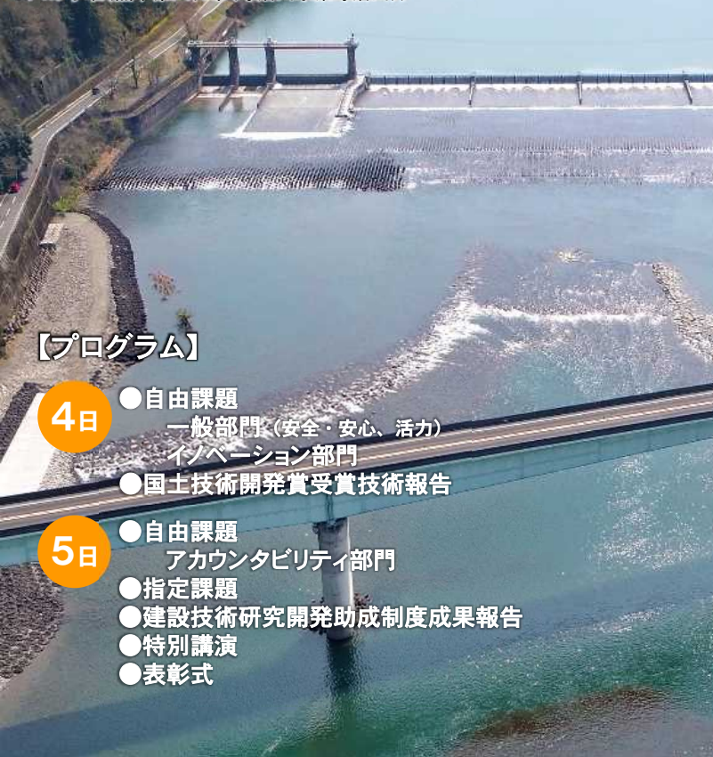
八の字堰(熊本県八代市(球磨川水系球磨川))