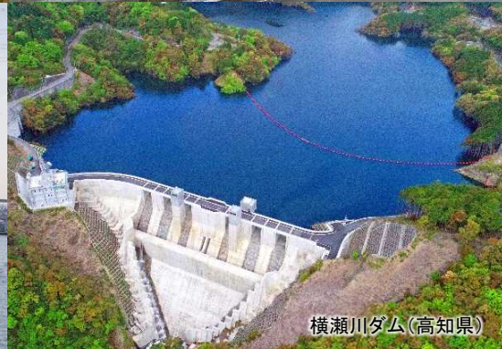
横瀬川ダム(高知県)