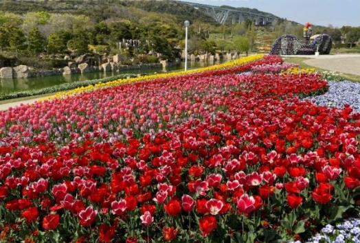
国営明石海峡公園淡路地区(兵庫県)