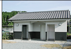
待合室・トイレのリニューアル