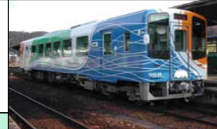
シャトル運行の実証実験