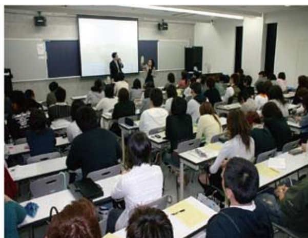
説明を熱心に聞く学生