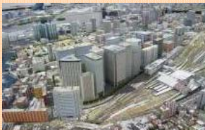
模型を活用した景観規制の合意形成