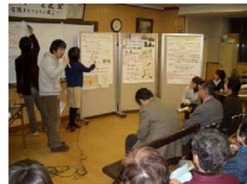
官民ワークショップの開催