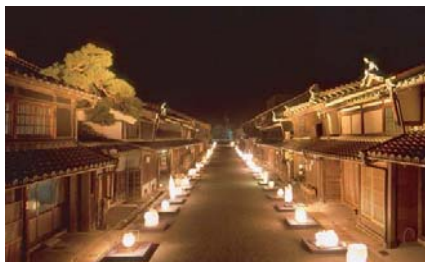
ライトアップ社会実験