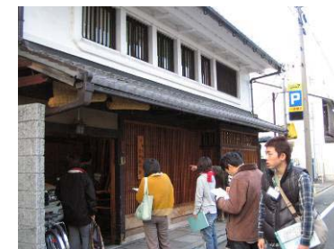
住民による地域の景観学習