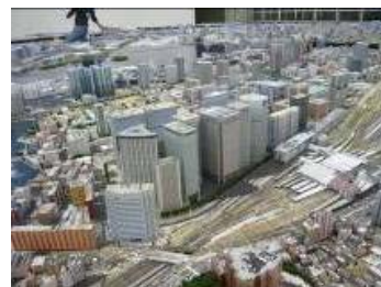
建築物の高さ制限の検討