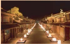
地域の景観を活かした社会実験