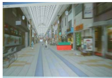
景観シュミレーション