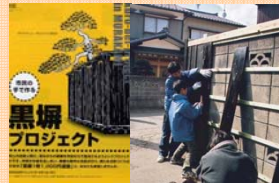
住民主体による景観形成の取組