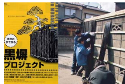
住民による景観形成事業