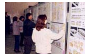
景観デザインコンペの実施