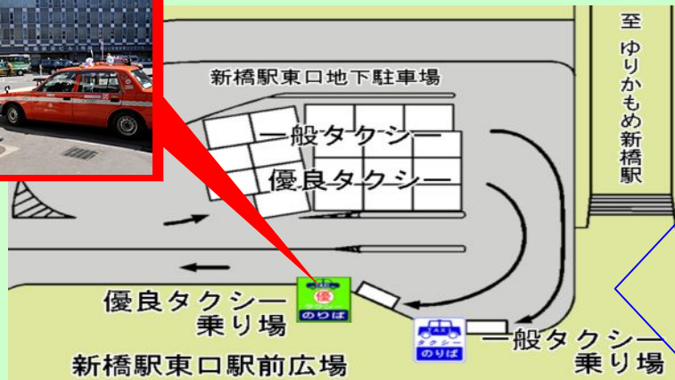
1日当たりの稼働状況(平成21年4月 調査) (台)