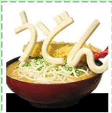
うどんタクシーの目印の行灯