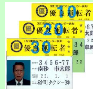
優良運転者表彰 を受けた運転者