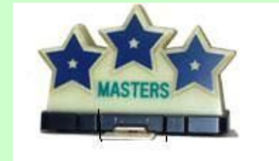
マスター(みつ星)の認定 を受けた個人タクシー