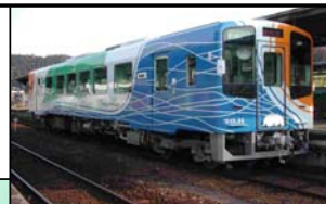
シャトル運行の実証実験