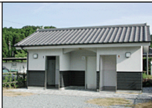
待合室・トイレのリニューアル