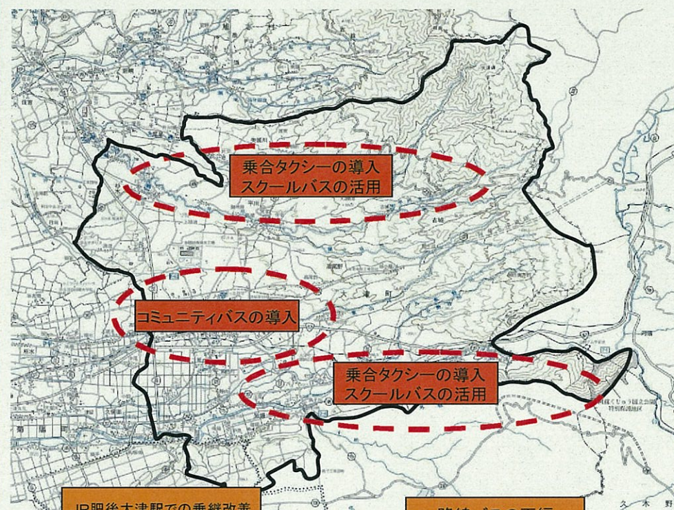
JR肥後大津駅での乗継改善