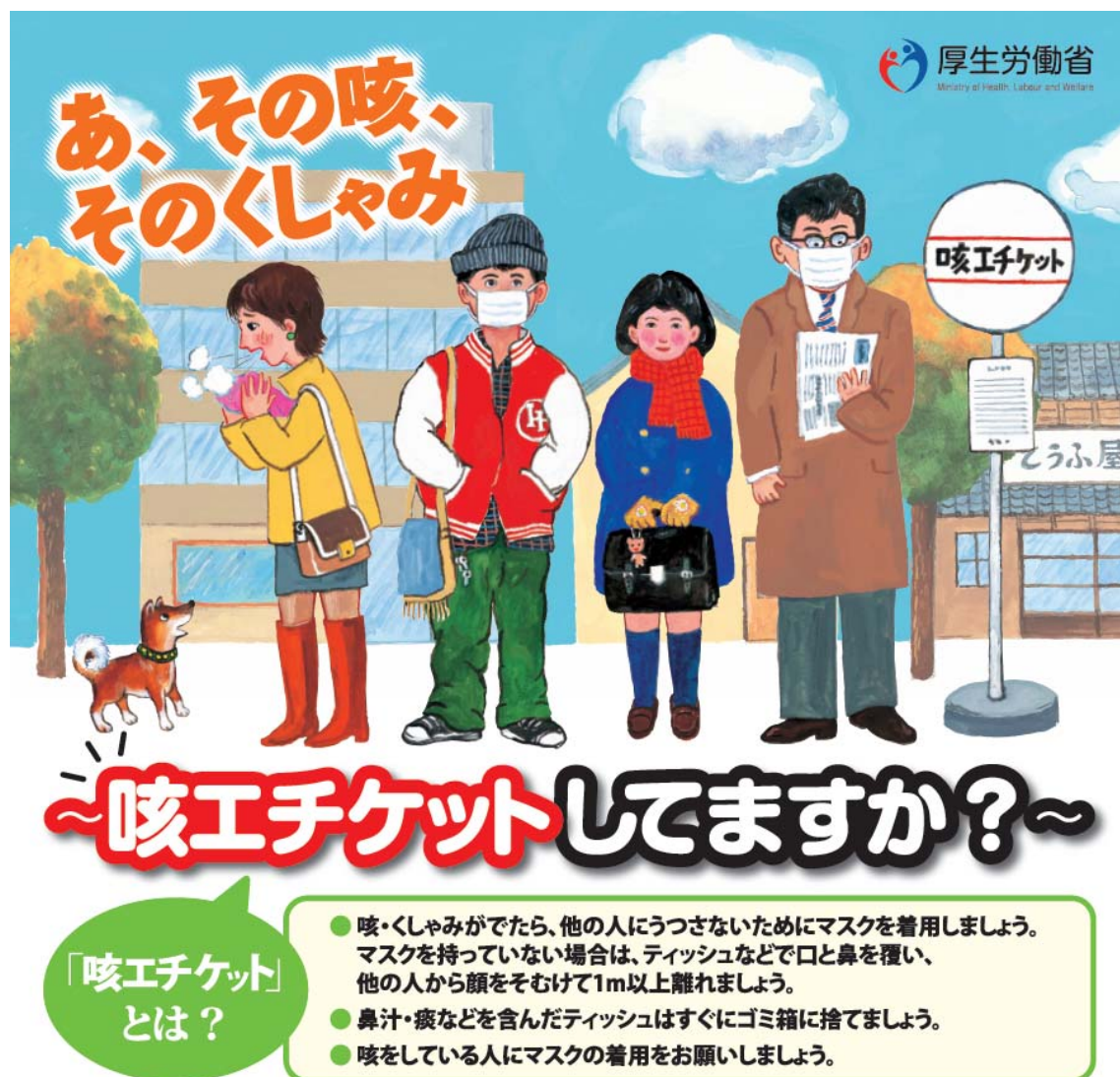
図4：咳エチケットに関する厚生労働省作成資料（一部抜粋）

た場所、特に屋内や乗り物など換気が不十分で閉鎖的な場所に入るときにマスクを着用することが重要である。