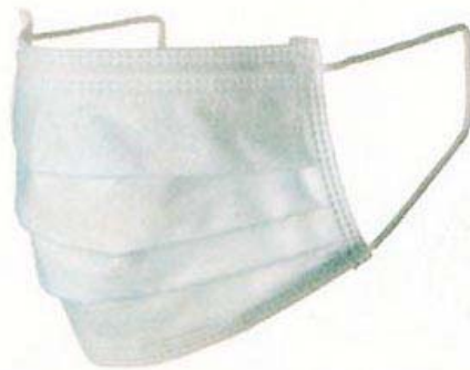
図5：不織布製マスク

症状のない場合は、マスクをすることによる感染予防が一定の効果しか期待できないため、マスクによる防御を過信せず、咳や発熱などの症状のある人に近づかない、人混みの多い場所に行かない、手洗いにより手指を清潔に保つ、うがいを励行する等の感染防止策を徹底することが重要である。