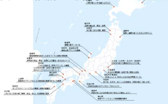
【事例（カルテ作成分22地域）】

また、モデル地域の取り組み課題を踏まえ、8地域に対して成功要因等のヒアリングを実施するとともに、成果分類別の成功要因に関する考察を行った。