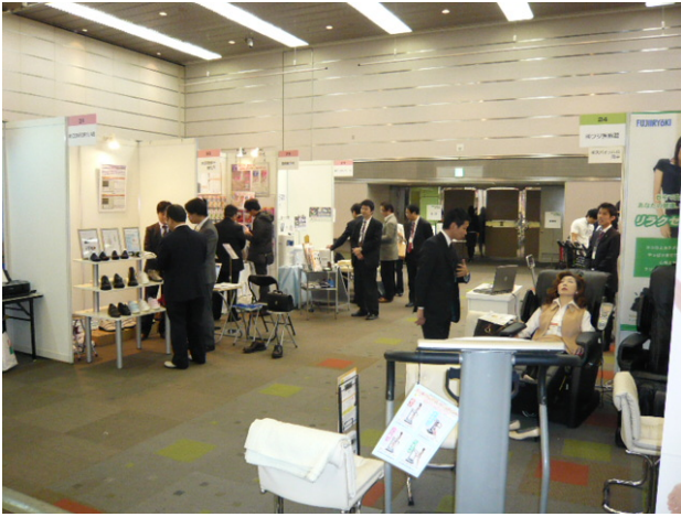
図表 1-7 マッチング会の様子