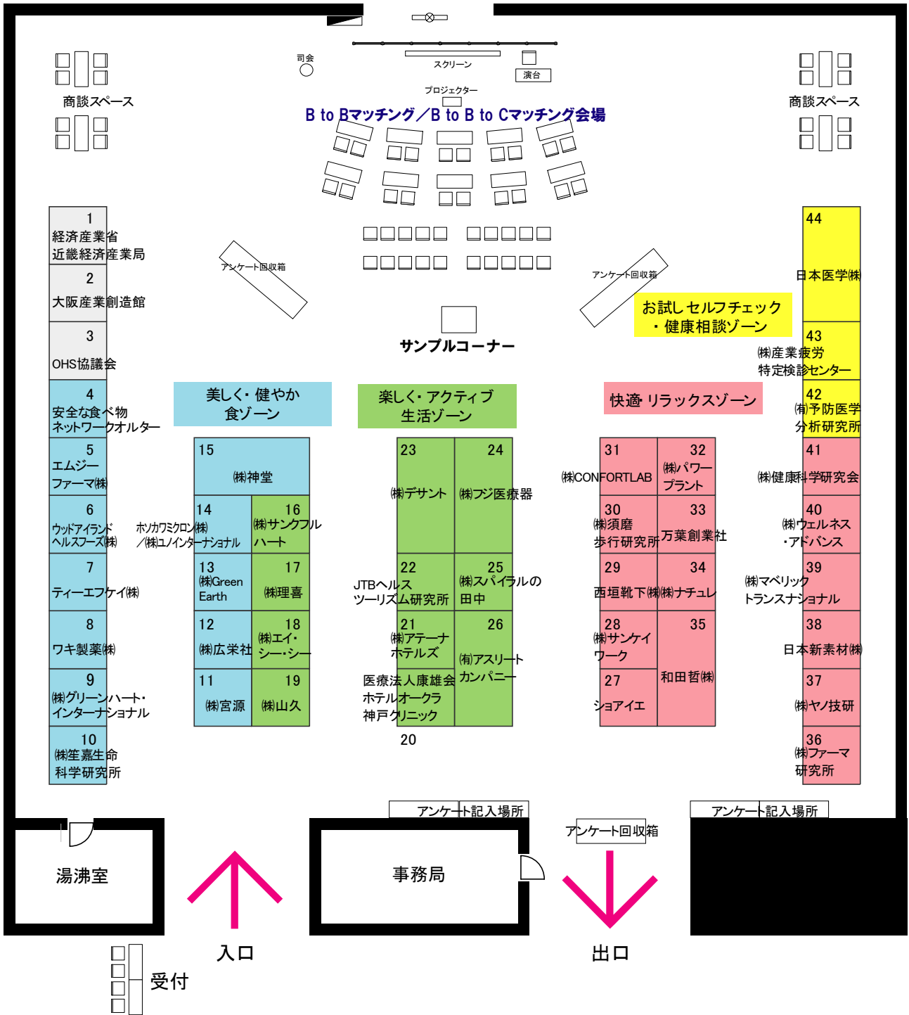
図表 1-4 会場図面