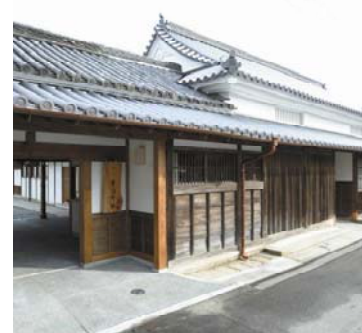
酒・醤油業:「佐野家」 (旧井筒屋)