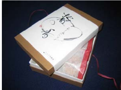
しょうゆまんじゅう(醤油)