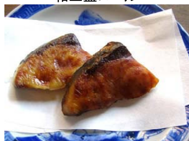
はまちのくんせい