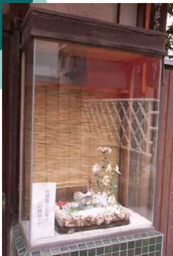
まち並みギャラリー