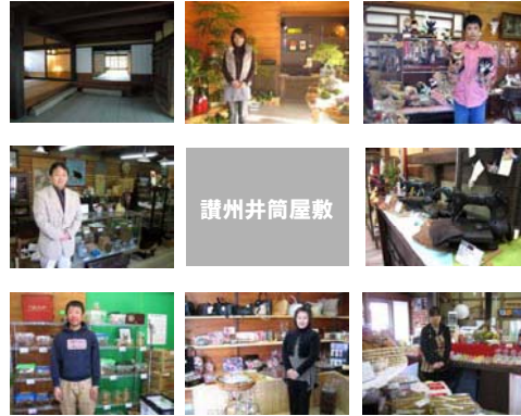
讃州井筒屋敷各テナントの様子