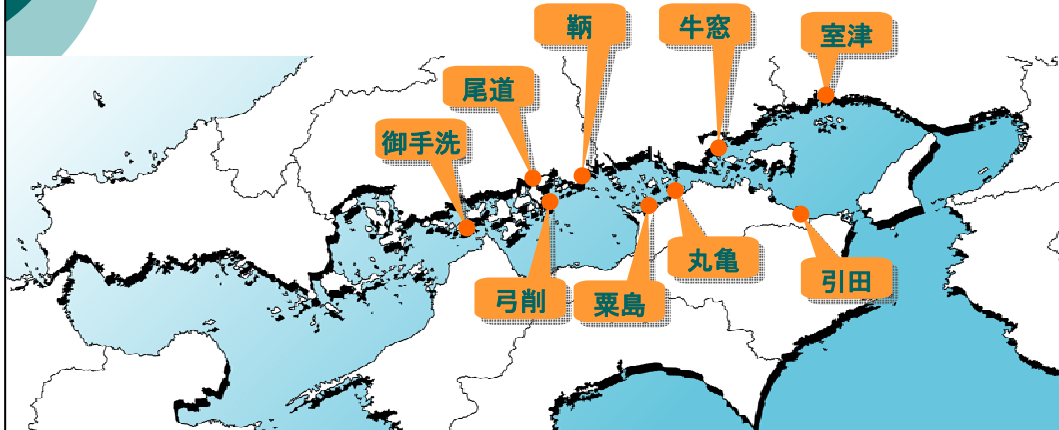
広域連携のイメージ図