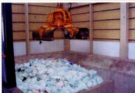
回収された使用済み紙おむつ。

取り出されたパルプは上質なもの紙おむつや防火板(パルプモールド)として再利用ができ、低質なものは土壤改良材などに利用される。プラスチックはRDF燃料に、汚泥は土壤改良材となる。紙おむつを裂く技術や分離させる技術、こうした技術面でさまざまな試行錯誤があったことはもちろんだが、同社にとってこの事業を行う使命は、「廃棄が社会的問題となりかねない使用済み紙おむつを有効に回収・リサイクルするシステムを構築すること(同社)」にある。病院や介護施設ばかりでなく、一般家庭へもモデル地区を設けて実証実験を行いたいと、行政への働きかけも行っているようだ。紙おむつのリサイクルは高齢化・在宅介護の時代に行政と民間がタイアップしてやるべき事業であると同社は確信する。「高齢化社会では食事より排泄が問題になると思うんです。社会的に認められる技術なら、その技術を使った社会システムをどう作るかを優先すべきです。そのためには現状の法律の解釈や運用などを