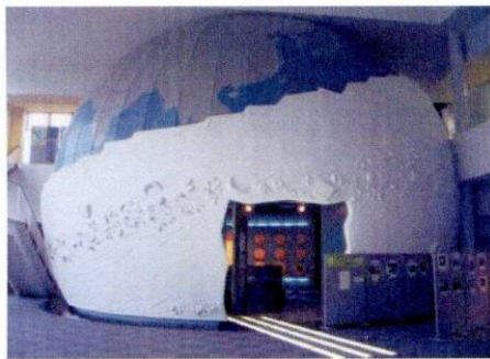
交流・学習センターのパビリオン。地球を宇宙船に見立てている。