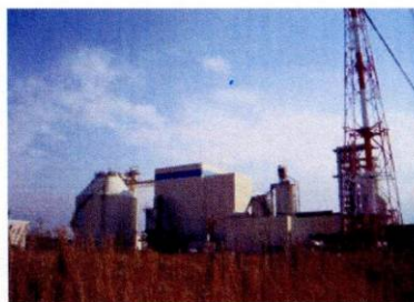
大牟田エコタウンの中核施設である。

大牟田リサイクル発電株式会社:大牟田市健老町472 大牟田・荒尾清掃施設組合:大牟田健老町468