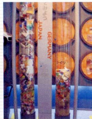
リサイクル情報などをわかりやすく体験でき、利用者から好評である。

大牟田市エコサックセンター：大牟田市健老町地先（大牟田エコタウン内） TEL 0944-41-2735 URL: http://www.ecosanc.or.jp