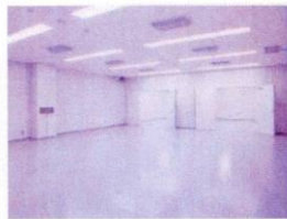
様々な用途に対応できる分析室。