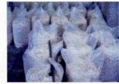
出荷を待つバルブ。