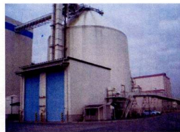
ベルトコンベアでRDFセンターから発電所にRDFが送られる。