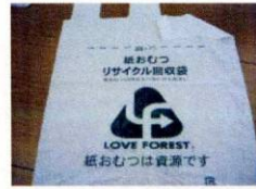
リサイクル専用の回収袋(45ℓ)。

弾力的にしてほしいと思うこともあります(同社)」。この工場を見学に来た女性の多くは、紙おむつリサイクルシステムの必要性を理解してくれるそうだ。マスコミの取材も多く、注目度が高まっている。近い将来、高齢化社会対策として紙おむつのリサイクルが全国で当たり前になる時が来るかもしれない。