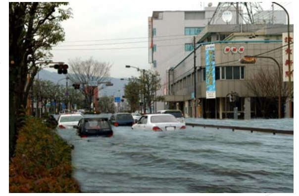
浸水深50cmのイメージ