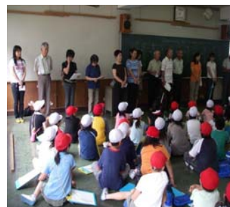
写真 校外学習引率スタッフ