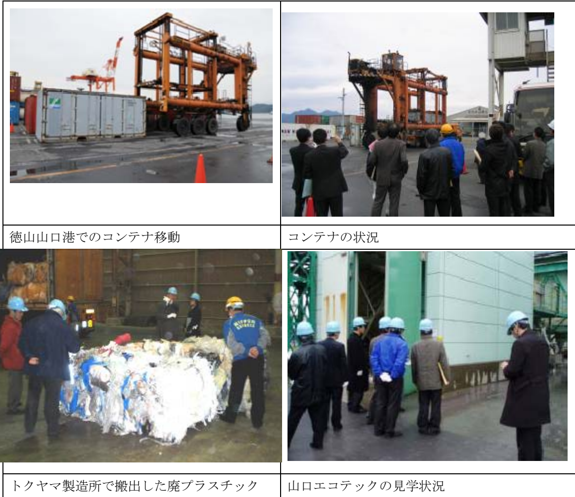
図 2-80 見学状況