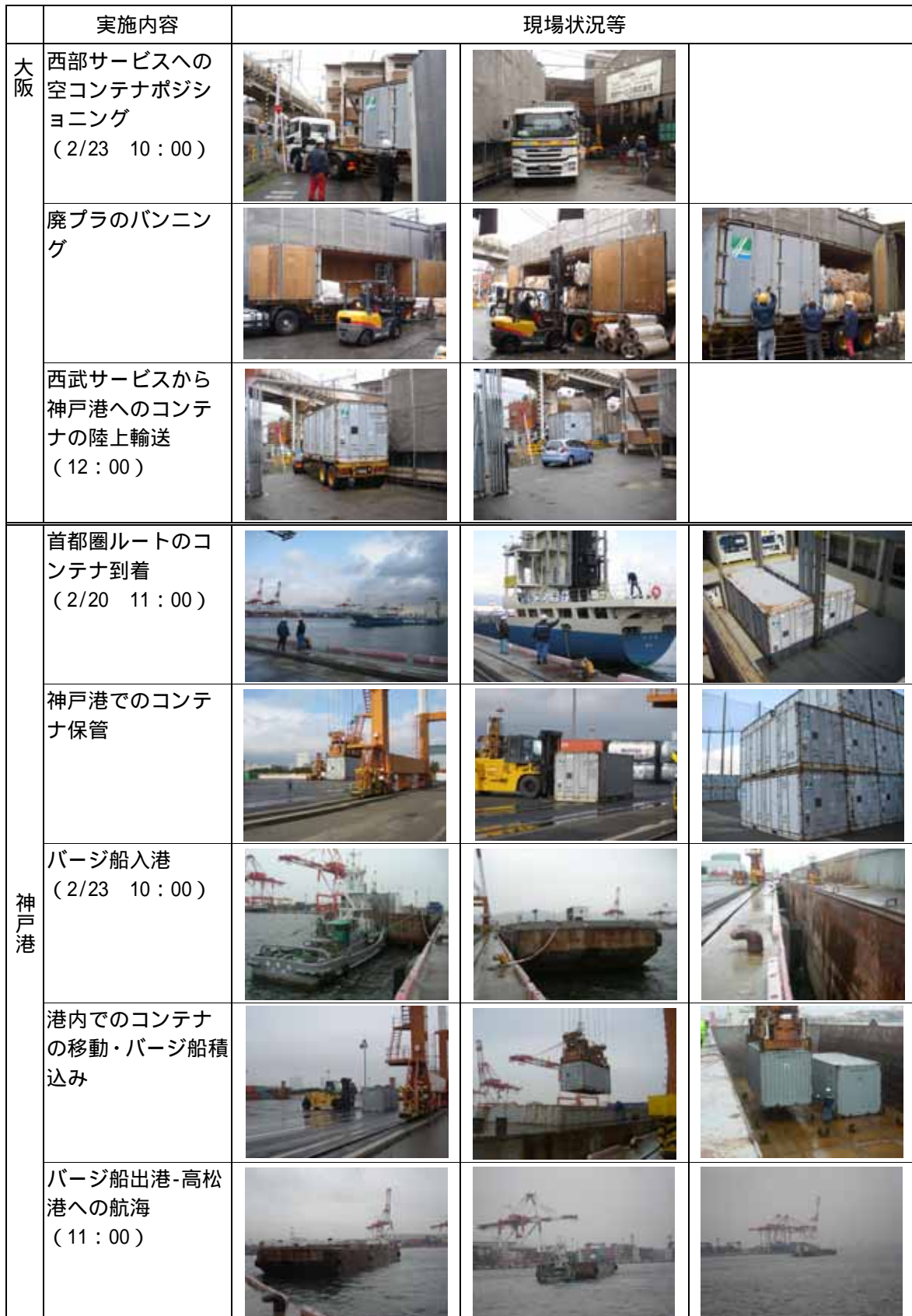
表3-18 現場状況の確認状況(その1)