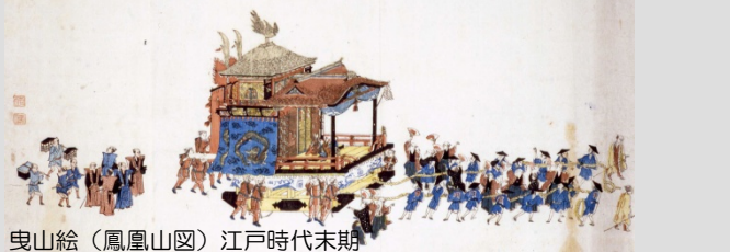
曳山絵（鳳凰山図）江戸時代末期