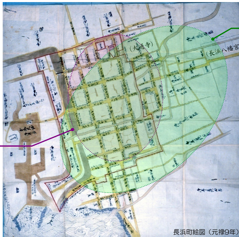
長浜町絵図（元禄9年）

大規模な寺観を誇る大通寺には大勢の善男善女がお参りし、その門前町は買い物や食事をする人々にぎわい、昔ながらの風情が漂っています。