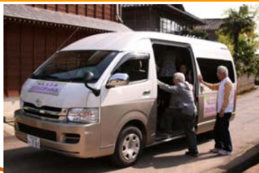
井栗コミュニティバス