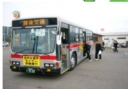
高校生 通学ライナー