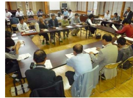
住民懇談会による見直し検討