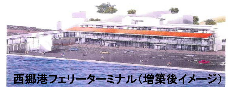
西郷港フェリーターミナル(増築後イメージ)