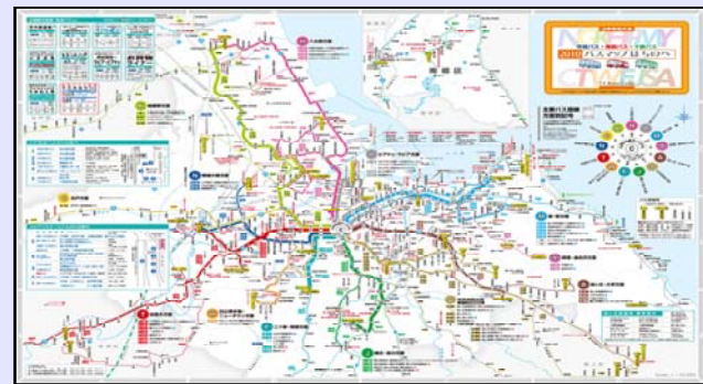
3事業者共通 '10バスマップはちのへ

中心市街地において、路線バスに関する「わかりやすい」のりば案内や行先案内等の情報を提供する。