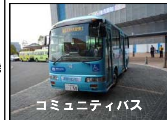
コミュニティバス