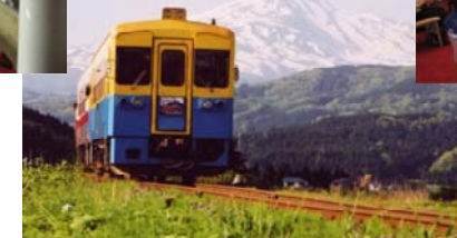
開業25周年 記念講演会・シン ポジウムの開催