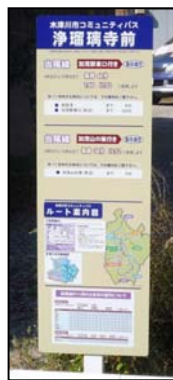
分かりやすい情報提供整備