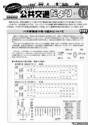
公共交通だよりの発行