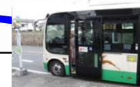
コミュニティバスの実証運行