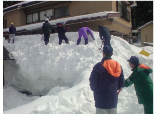
安全管理係による見守り（尾花沢市）

作業当日の役割として、除雪作業中の事故発生を防ぎ、活動の安全性を確保するための「安全管理係」の配置が強く求められます。屋根からの転落防止のための命綱・ロープの使用やヘルメットの着用、はしごの固定等を指示・指導したり、除雪作業を見守り、作業中の人に声をかけて注意を促したり、活動場所を巡回して危険がないかを確認するなどして、事故の発生防止に努めます。