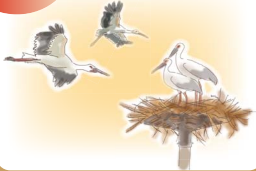
Stage.A : 飼育・放鳥の拠点施設整備

南関東地域において、多様な主体が協働・連携し、コウノトリ・トキを指標とした河川及び周辺地域における水辺環境の保全・再生方策の実施を通じて、コウノトリ・トキの野生復帰に向けて魅力的で内発的な地域づくりのための地域振興・経済活性化方策を投影したエコロジカル・ネットワークの形成を目指す広域連携モデルづくりを推進します。