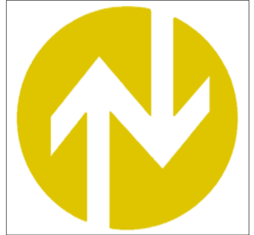
定期検査報告済マーク

建築基準法第12条に基づいた制度で、日常、多くの人々が利用するエレベーター、エスカレーターやコースター、観覧車などを、安全で安心なものとして信頼され使用して頂くため、所有者・管理者の方々が、専門的な知識をもった検査資格者（昇降機検査資格者）による定期的な検査を行い、その結果を所轄特定行政庁に報告頂くよう、法律で義務付けられたものです。