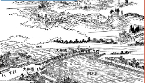
木曾路名所図会 大井驛

武並神社(重要文化財) や中山道沿いに町屋が位置する中山道大井宿村では、 武並神社例大祭 や 七日市 が町並みとともに地域住民によって大切に受け継がれている。