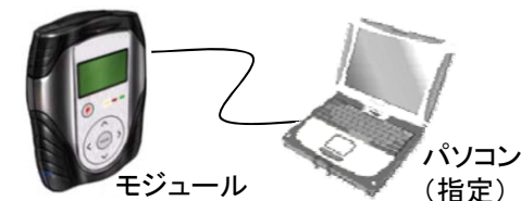
専用外部故障診断装置（専用スキャンツール）の例（各社で異なる）。