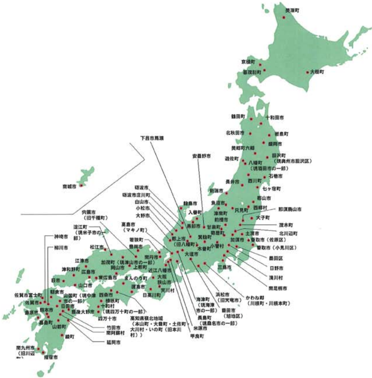
参考 8-5-1 水の郷百選分布図