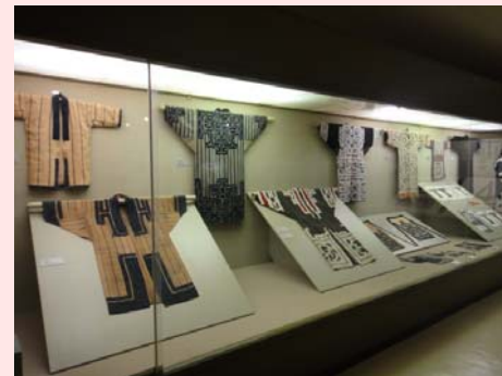
文化に関する展示