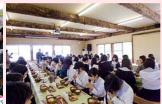
体験学習(食事体験)