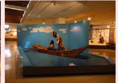
生活に関する展示