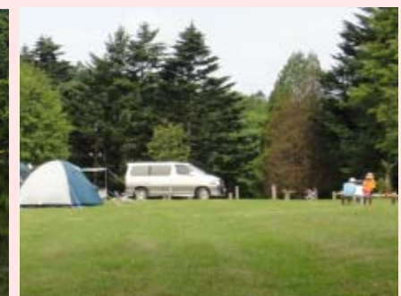
レクリエーション(キャンプ)