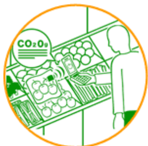
カーボン・フットプリントで 商品を選択