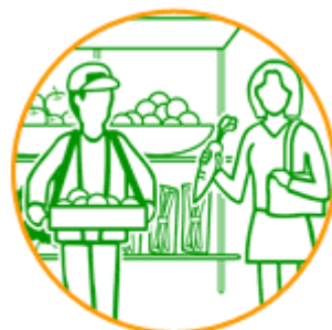
地元食材を使って 地産地消