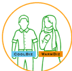
クールビズや ウォームビズの実践