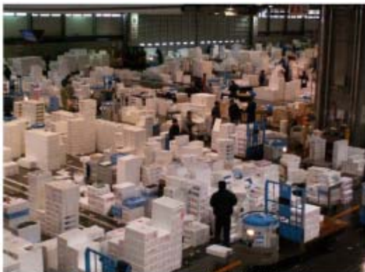
CNG構内運搬車による荷捌き