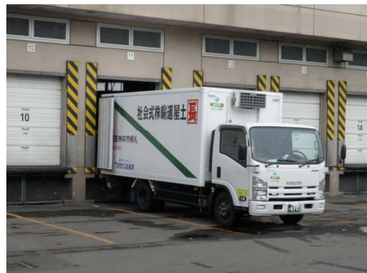
共同配送に使用の天然ガストラック