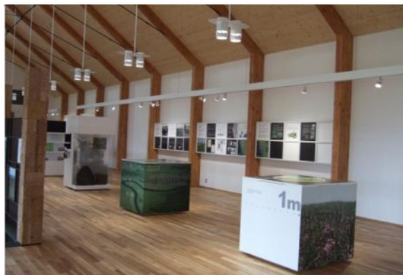
(円山園地ビジターセンター)