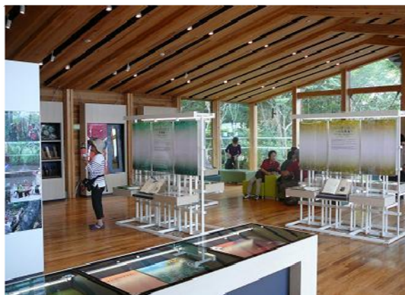
(那須平成の森フィールドセンター)