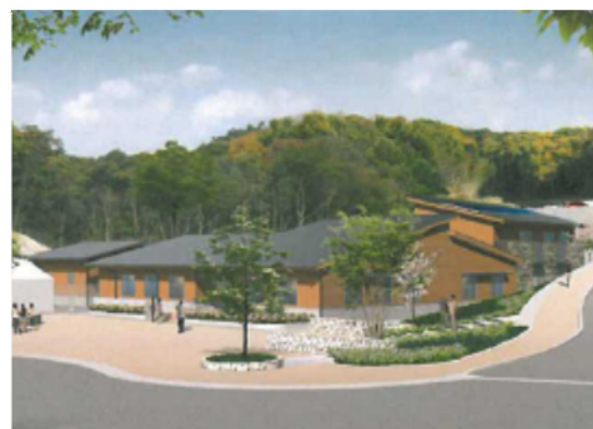
(国営アルプスあづみの公園 穂高ゲート)