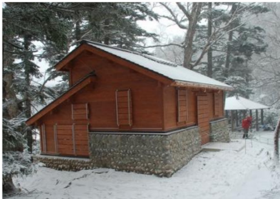
(志賀山周回線歩道公衆トイレ)