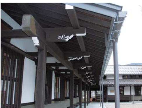
建物を建てた大工達の様々な「雲」を見ることができる。