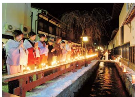
三寺まじりの千本ろうそく。願いをこめて白いうそくを灯してお参りする。願いが叶ったら次の年に赤いうそくを灯す。ろうそくの暖かな明かりが瀬戸川を照らす。