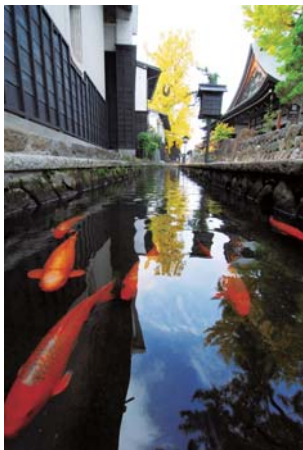
瀬戸川を泳ぐ鯉。4月~11月には1,000匹放流されている。