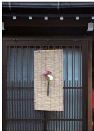
町には「花で町並みを飾る会」により、至る所の軒下で花が飾られているのを見ることが出来る。飛騨古川を訪れた方に、いい町を見ていただくために何かできないかと、13名の女性が集まり、取り組みが始まった。