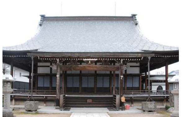
明治の大火からまぬがれた円光寺。