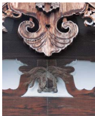
明治の大火から寺を守ったといわれる「水呼びの亀」の彫刻を見ることが出来る。

古川町には国の重要無形民族文化財に指定されている「古川祭」が毎年4月19日、20日に開催される。この祭りは「静」と「動」の祭りといわれている。「静」は屋台行列で飛騨の匠の技がほどこされ、華麗に装飾された9台の屋台が町を巡行する。「動」は起こし太鼓で数百人の裸の男たちが担ぐ櫓に大太鼓を乗せて町を巡行し、町内12組の付け太鼓をもつ男たちが町の辻々で大太鼓がけ我先にと突っ込