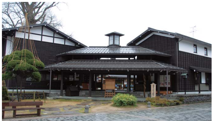
「飛騨の匠文化館」。建物は飛騨で育った木材を使い、飛騨の匠の技を受け継ぐ地元の大工さん達によって建てられ、組手や継手を用いているのが特徴。館内には大工道具の展示や木組みなどの体験コーナーがある。