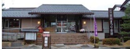
飛騨古川まつり会館。館内では古川祭を3D映像で体験、飛騨の匠の技と粋を集結した絢爛豪華な屋台など祭に関する様々なものを見ることが出来る。