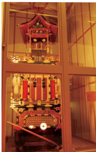
現在も実際に祭で使われている清濁台。町には9台の屋台があり、そのうち3台を定期的に入れ替えて展示している。