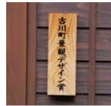
上/古川町景観デザイン賞を受賞された家。昭和60年から始まり、平成22年度までに111件のデザイン賞が受賞され、古川らしい町並みの保存に住民も積極的に取り組んでいる。受賞者の家には「古川町景観デザイン賞」の表札が掲げられている。左/「景観デザイン賞」表札。

町では毎年1月15日には「三寺まいり」が行われ、静かな寺院の佇まいの中、揺れる和ろうそくの炎や大雪像ろうそくの暖かな灯りが町を彩る。その昔、若い娘たちが着飾って瀬戸川べりを歩いて巡拝し、男女の出会いが生まれたという。 「信州へ出稼ぎに行っていた娘達も三寺まいりを楽しみにしていて、正月には帰省し、着飾って巡拝したと聞いています」と森専務理事。