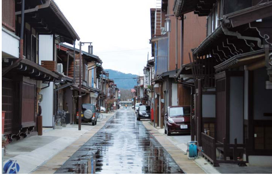
落ち着いた佇まいの町並みが残る武家町の町並み。