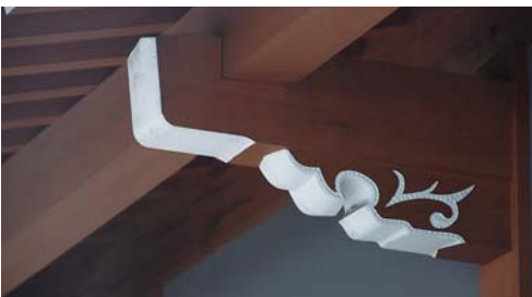
古川大工の誇りを示すシンボルの「雲」。大工一人ひとり形が決まっている。町を歩くと様々な形の「雲」に出会うことができる。