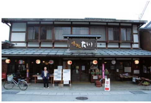
旅人の駅でもある「味処古川」。市街地中心部にあり、飛騨の匠の伝統技術を駆使した町家造りの店舗。各種おみやげ、朴葉味噌や飛騨牛など古川ならではの味が堪能できる。近隣には「飛騨古川まつり会館」、「飛騨の匠文化館」、「円光寺」などもあり観光の拠点として最適。営業時間9:00~17:00(ラストオーダー16:00)、不定休。