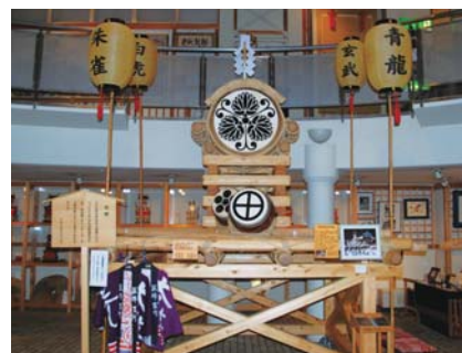
起こし太鼓と付け太鼓。展示用で本物は神社で保管している。