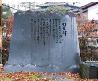
明治から大正にかけて、古川周辺の多くの若い娘たちがここから信州に向け、野麦峠を越えて行った。