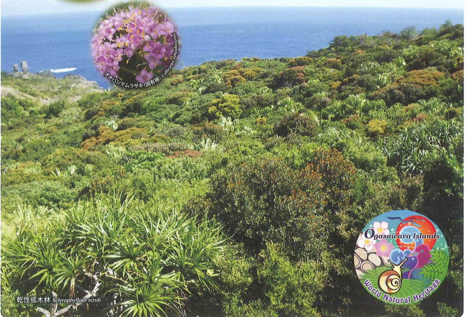
乾性低木林 Sclerophyllous scrub