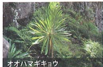
オオハマギキョウ

もともと草である植物が、海洋島という特殊な環境の中で、木へと進化することがあります。小笠原諸島では、キキョウの仲間であるオオハマギキョウ、キクの仲間であるワダンノキ、ヘラナレン、ユズリハワダンが草から木へと進化しました。