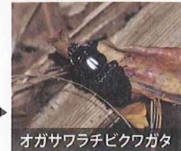
オガサワラチビクワガタ