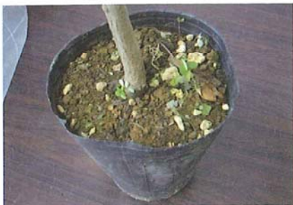
土の中に含まれる雑草

日本の本土から小笠原に広がるおそれのある、植物や動物、土や土のついた苗などを持ち込まないようにしましょう。