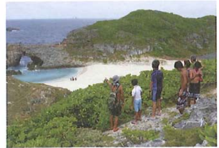
エコツーリズムの様子(南島)

遊歩道やきめられたルートの利用ルールを守り、ルートから踏み出さないようにしましょう。