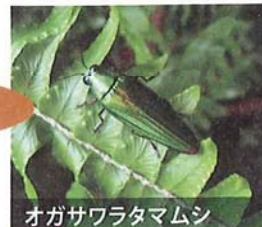
オガサワラタマムシ