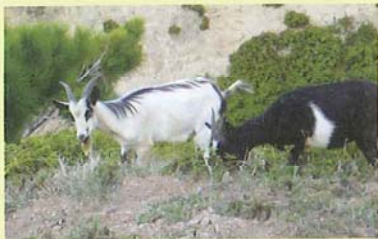
固有植物を食べるノヤギ

人によって他の土地から持ち込まれた外来種の影響により、小笠原固有の生きものの数が急激に減っています。現在、本来の生態系を取り戻すために、関係機関と地域住民が協力しながら、外来種を排除する取組みが進められています。