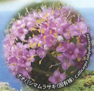
オオハシマムラサキ (固有種) Callitriche subpubescens