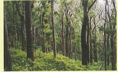
在来の樹林をおいやってできたアカギ林