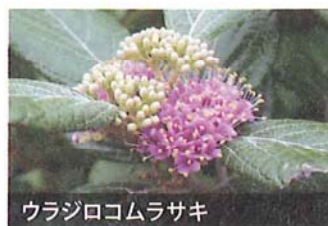
ウラジロコムラサキ

一つの花に雄しべと雌しべがある花を「両性花」といいます。小笠原では、もともと両性の花を咲かせる植物が、独自の進化を遂げて、オスの花をつける株とメスの花をつける株に分かれるよう進化したものがあります。これは、安全に多様な子孫を残すための工夫だと考えられています。