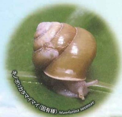
マンボウガイ (固有種) Mandarina suenoi