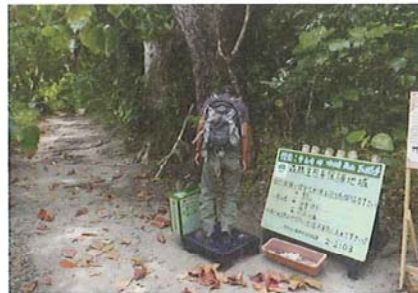
遊歩道入り口での外来種除去

山の中や他の島に行くときに、靴の裏や服、荷物に、種や小さな虫などがくっついたりまぎれ込んだりしていないかチェックするようにしましょう。