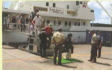
靴裏洗浄による拡散防止(母島沖港)