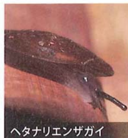
ヘタナリエンザガイ

小笠原ではカタマイマイの仲間以外でも、多様な進化を遂げたユニークな陸産貝類を見ることができます。