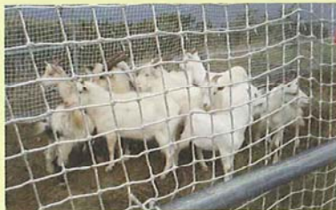
追い込みによるノヤギの捕獲