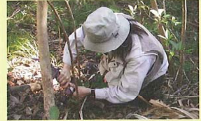
薬剤注入による枯殺