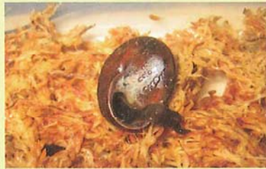
陸産貝類を食べるニューギニアヤリガタリクズムシ