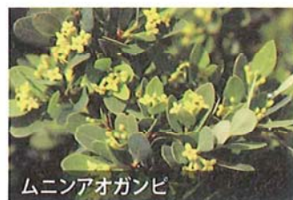
ムニンアオガンビ