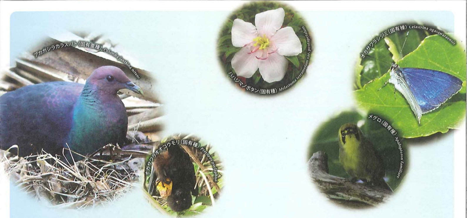
アカガシラカラスバト (固有亜種) Columba janthina nitens