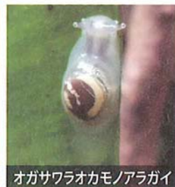
オガサワラオカモノアラガイ