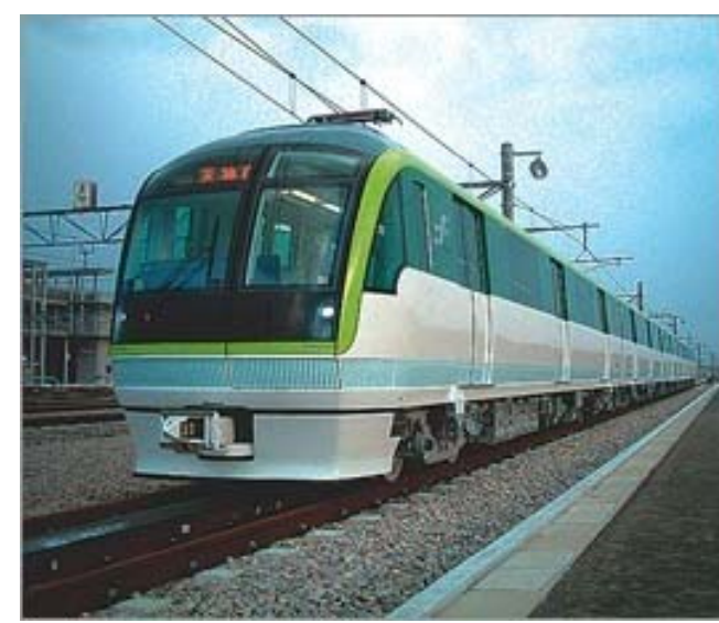
リニア地下鉄の例 (都営大江戸線、福岡市交七隈線)