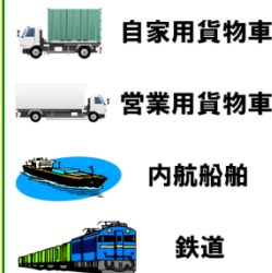
輸送機関別CO 2 排出原単位 (平成20年度) 単位: G-CO 2 /トンキロ