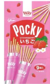
いちごポッキー（9袋）

(注) 「ポッキー」は第21回「エコルールマーク運営・審査委員会」（平成22年4月）で商品認定を受けていますが、登録商品の変更のため、今回新たに認定を受けたものです。