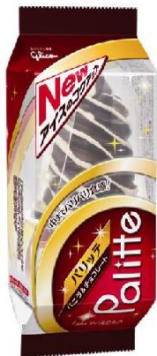
⑤パリッテ 【江崎グリコ株式会社】