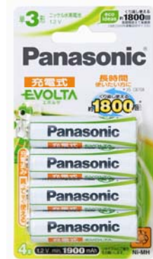
②充電式 EVOLTA 【パナソニック株式会社】