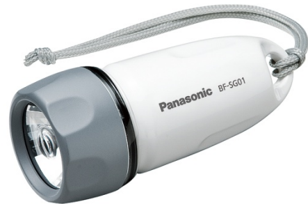
④Panasonic 電池式 LED ライト 【パナソニック株式会社】