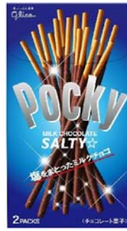
ポッキー〈ソルティ☆〉