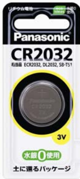
③Panasonic マイクロ電池 【パナソニック株式会社】