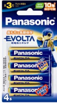
①Panasonic 乾電池EVOLTA 1.5V リチウム 【パナソニック株式会社】