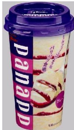
⑥パナップ 【江崎グリコ株式会社】