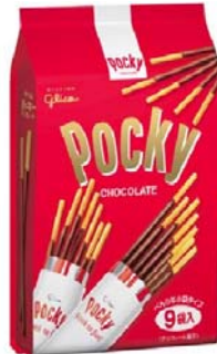
ポッキーチョコレート（9袋）