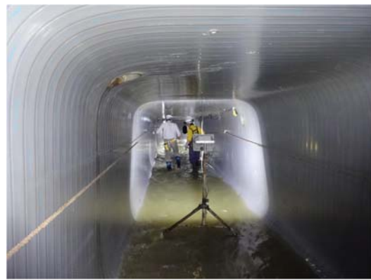
下水道管きょ内の状況