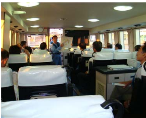
視察の状況（船上から）