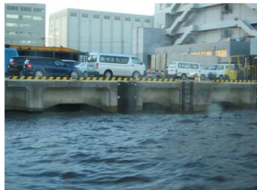
視察現場（大井食品埠頭）の状況