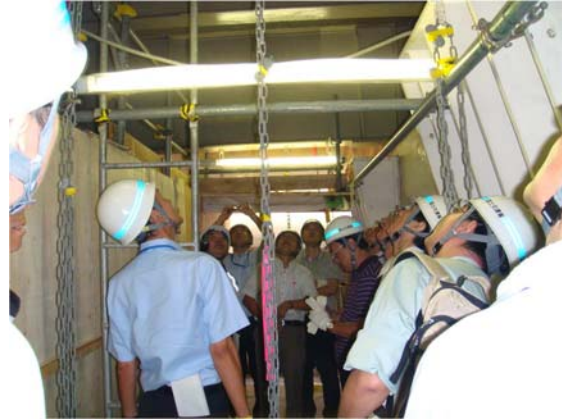
視察の状況（吊足場より）