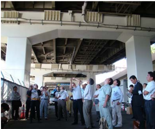
視察の状況（桁下より）

首都高速における高架橋床版裏側のコンクリート劣化状況、補修・補強工事について視察