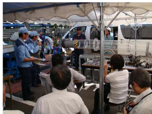
SPR 工法のデモンストレーション