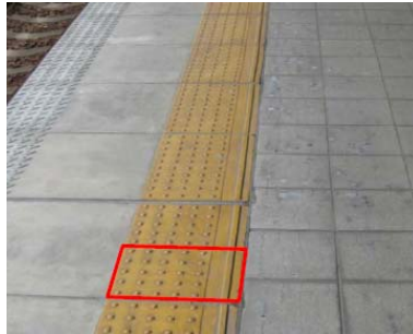
【内方線付きJIS規格点状ブロック】