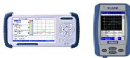
外部故障診断装置（スキャンツール）の例