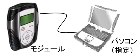
専用外部故障診断装置（専用スキャンツール）の例（各社で異なる）。