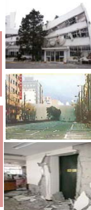
(※)東日本大震災後のA市役所の損傷状況