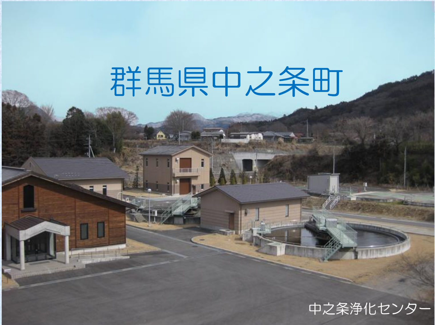
中之条浄化センター