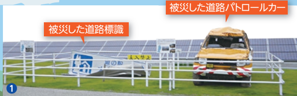
被災した道路パトロールカー